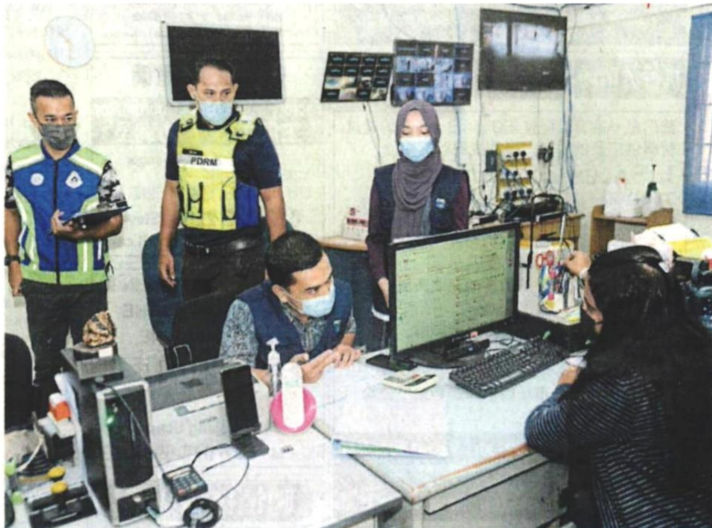
■ 市政厅和国家房屋局前往沙登SkyVillas组屋，援引757法令展开审计行动。

(梳邦再也13日讯) 梳邦再也市政厅与国家房屋局 (Jabatan Perumahan Negara) 合作，就2013年分层管理法令 (757法令) 在沙登SkyVillas组屋执行一个审计行动。