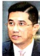
Mohamed Azmin Ali

"Dengan trajektori asas ekonomi Malaysia yang kukuh, faktor positif memacu prospek pertumbuhan serta jangkaan permintaan luaran yang lebih utuh terhadap produk kita, kerajaan sangat komited untuk memastikan pemulihan yang mampan dan mampan, pertumbuhan ekonomi saksama serta perkongsian kemakmuran secara bersama bagi Malaysia," katanya.