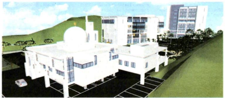
ILUSTRASI Kompleks AHK yang menawarkan pengajian bukan sekadar buat golongan muda, malah kumpulan berusia 40 tahun ke atas.

"Kami mengharapkan penyertaan lebih ramai umat Islam bagi bersama-sama membantu membangunkan AHK sebagai satu kewajipan kita beribadah dan bersedekah," katanya dalam sidang akhbar secara maya