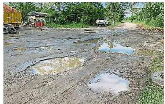
之前双文丹华小上学路太烂，引发家长和村民的极度不满。(档案照)

她说，她巡视时并未见到有此状况，所以呼吁村民和家长一旦有此发现，可向她、县议员或县议会投报，以免压毁马路的情况重演。