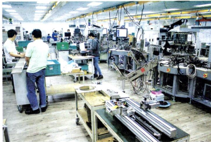
EKOSISTEM perniagaan yang stabil serta kondusif, selain penawaran tenaga buruh berkemahiran dilihat antara daya tarik negara untuk pelaburan berteknologi dan bernilai tinggi. – GAMBAR HIASAN

"Pelaburan melibatkan 2,110 projek itu dijangka mencipta