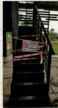
Pihak berkuasa mengambil langkah segera menutup bangunan tinjau di Taman Rekreasi Wetland Setia Alam.

Dalam kejadian pagi Ahad itu, mangsa dipercayai terjatuh dari aras dua bangunan tinjau di Taman Rekreasi Wetland Setia