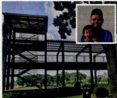
Mangsa dilaporkan terjatuh dari aras dua bangunan tinjau di Taman Rekreasi Wetland Setia Alam. Gambar kecil: Mangsa bersama bapa saudaranya.

untuk elak second brain injury . (Masa jatuh semalam first brain injury . Second brain injury adalah apa-apa injury selepas jatuh yang disebabkan oleh faktor lain.